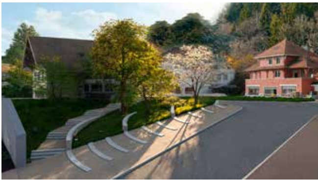
Ébauche créative de la place Vallet au Plateau d'Assy.