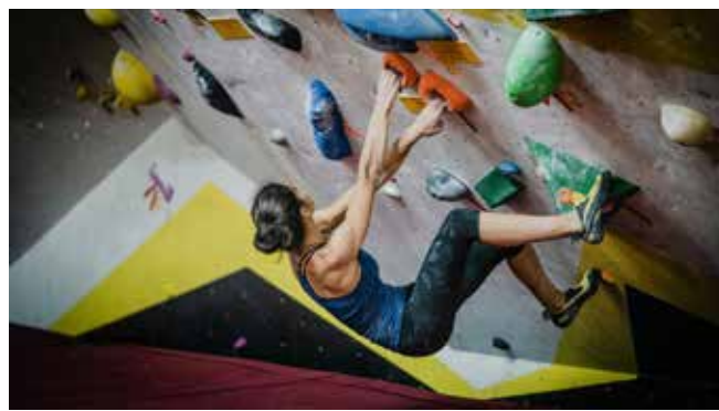
Le gymnase de Varens accueillera un espace d'escalade en blocs.