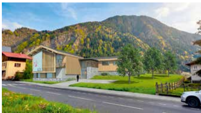
Ébauche créative du Pôle Enfance-Santé à Chedde.