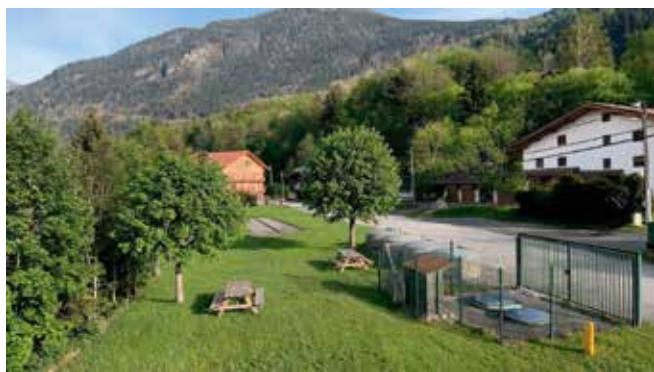
Un nouvel espace public paysager au hameau du Plan.