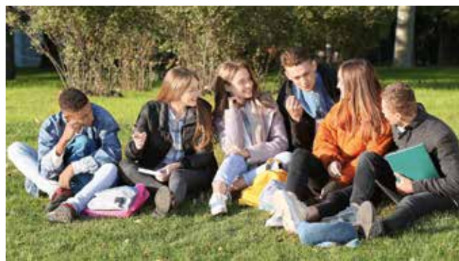
Donner à nos jeunes les moyens de s'épanouir.