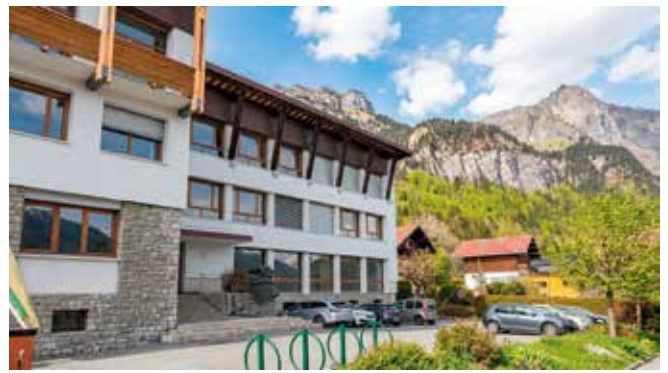
Le CIAP se situera au rez-de-chaussée du Centre Culturel rénové en 2024.